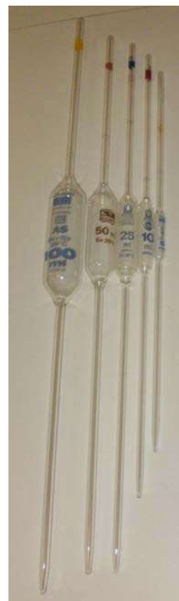
Pipettes jaugées de différentes contenances

Des embouts ou cônes de pipettes jetables sont utilisés si l'expérimentation l'exige, afin d'éviter toute contamination. Ces embouts doivent être le plus effilé possible, notamment pour les petits volumes, afin de mieux voir le volume prélevé.