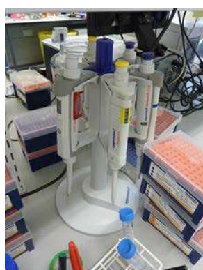
Pipette Gilson sur carrousel