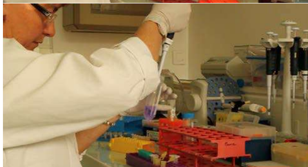
Utilisation de la pipette au Génomscope.