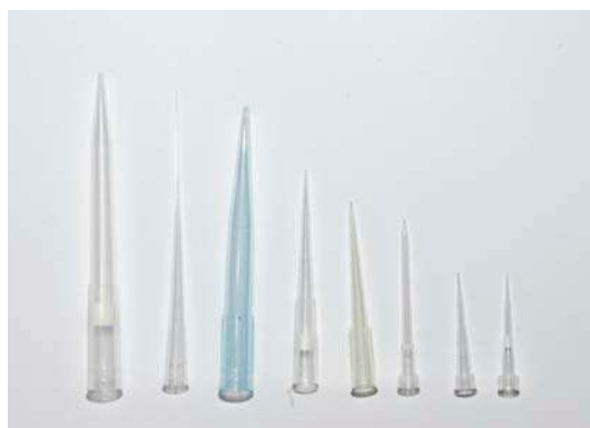
L'utilisation d'embouts est parfois nécessaire pour éviter toute contamination.

On peut rencontrer la pipette lors d'analyses médicales ou même être amenée à la manipuler pour cuisiner.