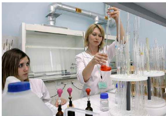
Manipulation de la pipette

Une fois le volume à prélever défini et la pipette insérée dans le béccher de prélèvement, on actionne le système de dépression afin d'aspirer le liquide. Dans le cas des pipettes graduées ou jaugées, on effectue la lecture de volume au bas du ménisque en maintenant l'œil face à la graduation pour éviter l'erreur de parallaxe*.