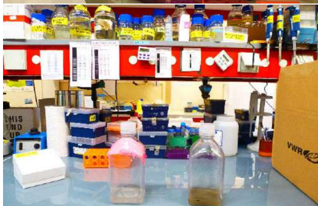
Verrerie d'un laboratoire.