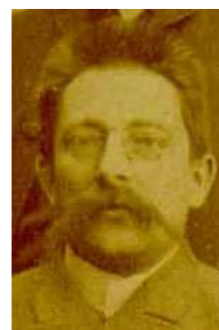
Richard Julius Petri