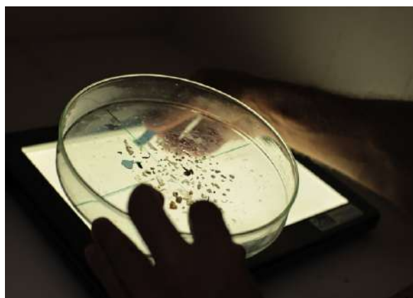
La boîte de Petri est placée sur une plaque lumineuse pour faire l'inventaire des microplastiques.

Dans le cadre de l'expédition Tara Méditerranée, les boîtes de Petri ne sont pas exactement utilisées pour la mise en culture de bactéries ou de micro-organismes... Leur transparence et leur profil plat font d'elles des récipients temporaires particulièrement commodes pour le tri d'échantillons de petites tailles tels que les microplastiques lors d'une station de prélèvement. Une fois les microplastiques triés, la boîte de Pétri est ensuite transportée à l'intérieur de la goélette, afin d'être prise en photo et éventuellement observée au microscope. Les échantillons sont ensuite placés dans des tubes afin d'être conservés avant expédition vers les laboratoires.