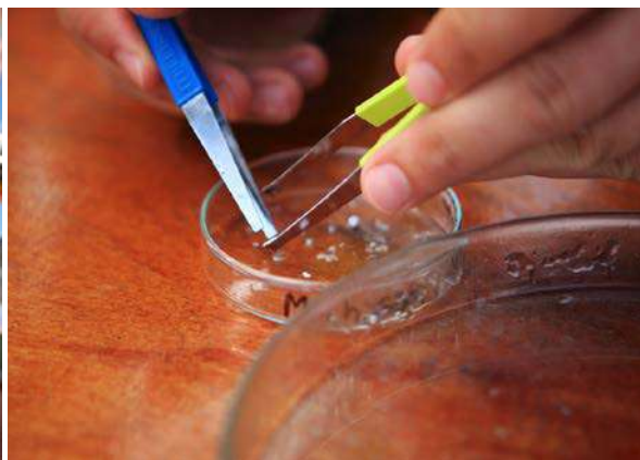
Le plastique se retrouve le plus souvent sous la forme de minuscules débris, à peine visibles à l'œil nu.