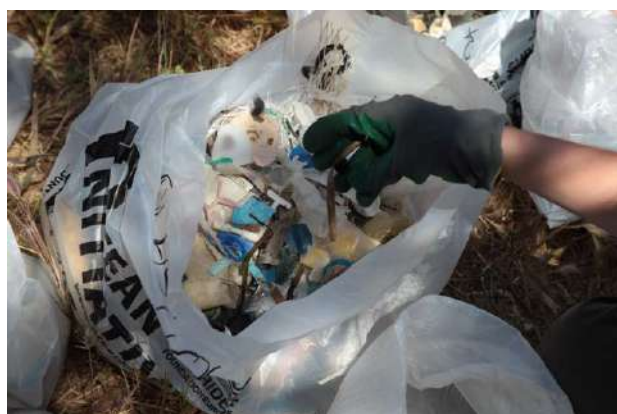
Collecte de déchets plastiques sur les plages.