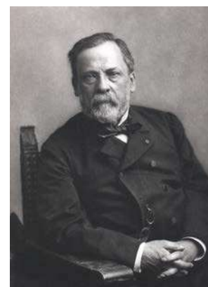
Louis Pasteur.

Louis Pasteur est le fondateur de la bactériologie. Il cultive entre autres les microorganismes sur des milieux liquides et est le premier à établir formellement le lien entre les micro-organismes et les maladies. Il devra combattre plusieurs années pour vaincre les partisans de la « génération spontanée* ». Ses bouteilles à col de cygne, qui laissent passer l'air mais pas les microbes, préfigurent ce qu'on attend d'une boîte de Petri.