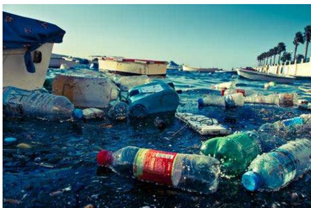
Pollution plastique dans un port maltais

450 millions d'habitants vivent sur les zones côtières de la Méditerranée répartis dans 22 pays riverains. Par ses caractéristiques géographiques et climatiques, la Méditerranée abrite aussi près de 8 % de la diversité biologique marine, même si elle ne représente que 0,8 % de la surface de l'Océan. Aujourd'hui ses mégapoles sont saturées, la Méditerranée concentre 30% du trafic maritime mondial, les difficultés liées aux pollutions venant de la terre se multiplient, mettant sous pression l'écosystème marin essentiel pour les populations et pour la vie en général. Parmi ces pollutions, la présence croissante de micro-plastiques dans la mer et sa probable incorporation dans la chaîne alimentaire, et donc dans nos assiettes, pose question. Il est urgent de comprendre les processus en jeu afin de proposer des solutions. C'est le rôle de la mission Tara Méditerranée, qui a eu lieu de mai à novembre 2014.