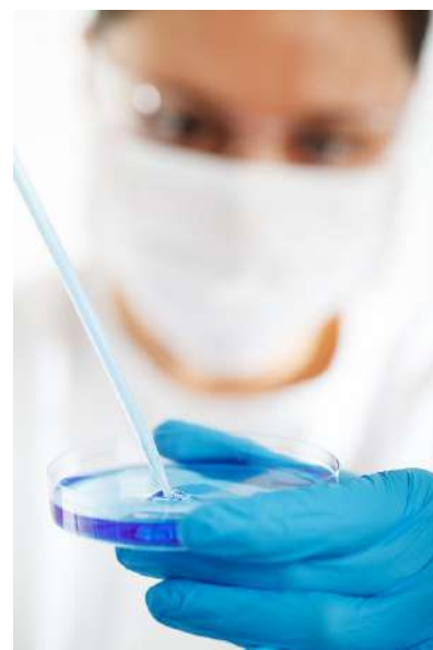
Introduction de bactéries dans une boîte de Petri

Un objet pour observer : la boîte de Petri est si pratique qu'elle a été détournée de son usage initial pour diverses applications. En effet, de par ses caractéristiques - transparente, plate, stérilisable, peu coûteuse et empêchant l'évaporation - elle se prête particulièrement bien à l'observation de petits éléments organiques ou non.