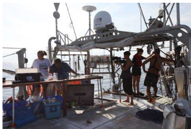
Le pont de la goélette pendant l'expédition Tara Med.