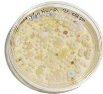
Boîte de Petri.

- Il est évident qu'une culture bactérienne ne doit en aucun cas être jetée sans avoir subi auparavant une décontamination. Il suffit de nettoyer avec de l'eau de Javel l'intérieur et l'extérieur des boîtes avant de les jeter.