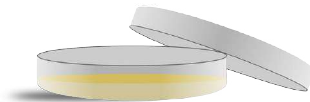
Boîte de Petri

Lorsque l'objectif de l'utilisation de la boîte de Petri est la culture de bactéries, la boîte de Petri est alors partiellement remplie d'un liquide nutritionnel (composé de minéraux) permettant le développement du micro-organisme étudié. Le milieu de culture est composé d'une base qui peut être de l'agar-agar*, sous forme gélifié, ou un bouillon de culture totalement liquide.