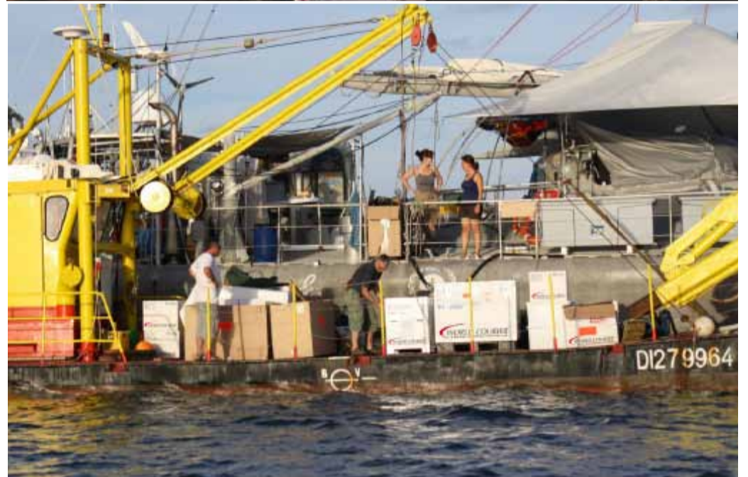
Le déchargement des échantillons au milieu du lagon de Mayotte.